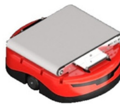
Robot de clasificación de cinta transversal