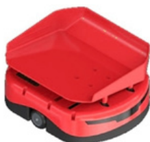
Robot estándar 2