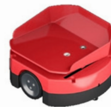
Mini Robot de clasificación con plataforma inclinada