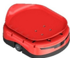
Robot estándar I

El robot de clasificación es el producto estrella en las soluciones de clasificación para cualquier tipo de entorno e industria imaginable. Al incorporar distintos dispositivos de carga opcionales, se logra una personalización integral de la aplicación, otorgando la versatilidad necesaria para adaptar las soluciones a una infinidad de aplicaciones. Las diferentes versiones de robots se adaptan a distintos artículos pequeños y medianos.